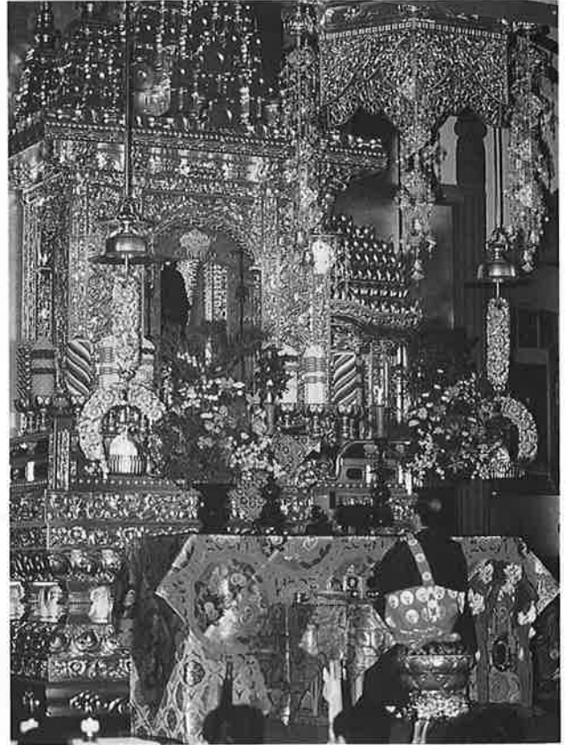
ご門主ご親修で正信念仏偈をおつとめ