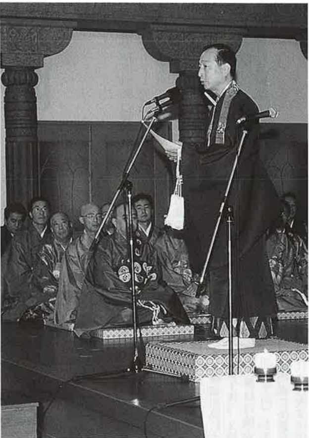
ご親教を述べられる即如ご門主

念仏申させていただきまして。この別院の沿革、また昭和五年より三年前まで「モダン寺」として親しまれていましたご本堂につきましては法要のしおりに譲りたいたいと思いますが、蓮如上人五百回遠忌を間近に控えたこの時に完成されたこの建物は、先代に負けない斬新さと機能性、そして仏教的特色と風格を備えていま