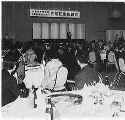
ポートピアホテルで祝賀会 約300人が出席 貝原俊兵兵庫県知事も出席して祝辞