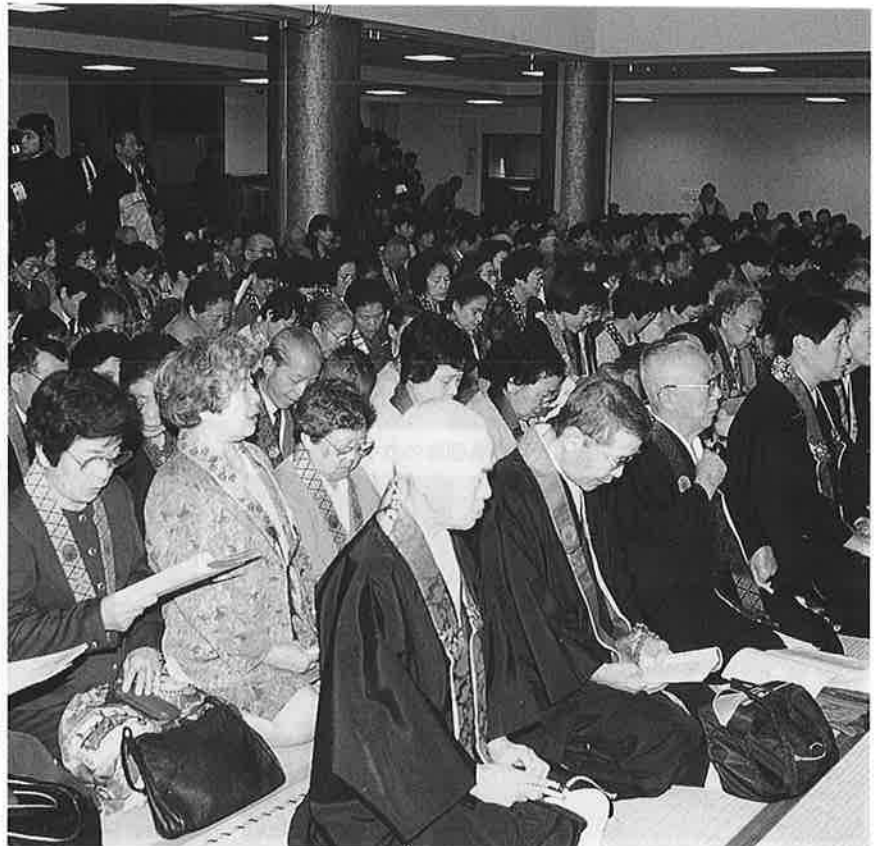
椅子を取り除き、畳を敷きつめ満堂となった本堂 最前列は住職席、その後ろから内信徒、会議室・総会所にも参詣者で一杯