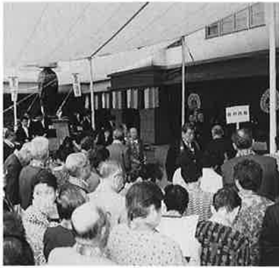
前庭で組名のプラカードをあげて誘導