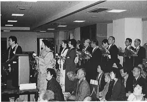
献華・献灯に整列して待つ各団体の方々