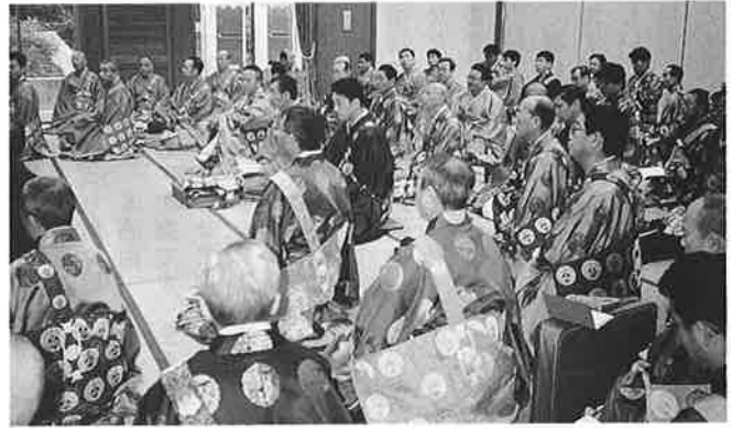
出勤前の法中のみなさん