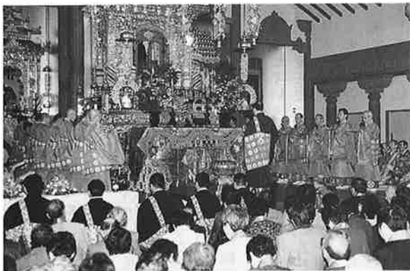
十一句念仏で座前立列の結衆