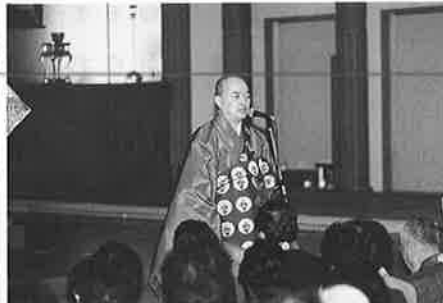
あいさつの土基輪番