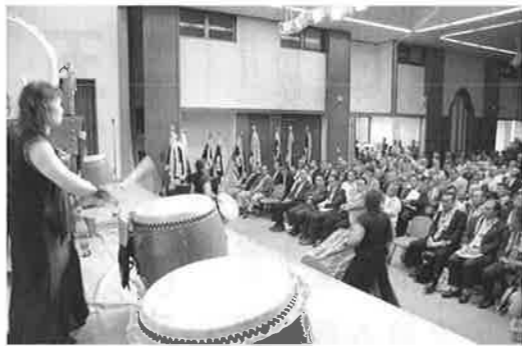
和太鼓を聴く仏社会員

五月二十三日、「兵庫教区仏徒連盟 第三十五回報告総会、阪神・神戸大会」が開催された。教区を数ブロックに分け、各ブロック毎年持ち回りで開催される報告総会、今年は阪神・神戸ブロックのお世話で、会場は施設拡充工事が終わったばかりの神戸別院で、六百名近くの参加を頂いての開催となった。