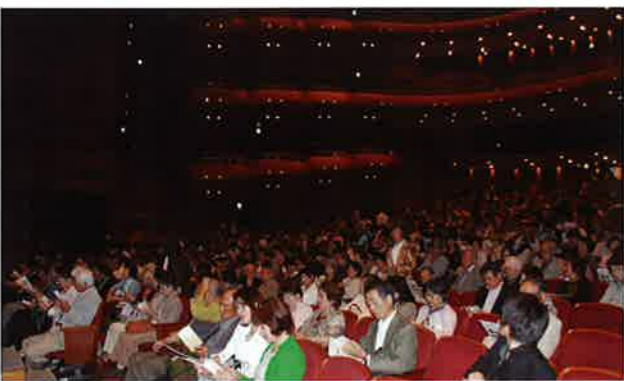
講演参加者で一杯の大ホール

母の愛にたとえ、慈父、慈母という表現でもって表し、慈父が人を励ましていく力、悲母を人の悲しみに寄り添っていくこと、としますと、現代のプラス・マイナスの思考法では、慈父の方、プラスの面ばかりを追って行き、