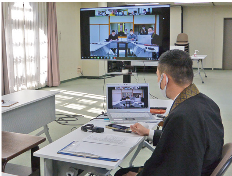
PCを使って会議が進む

それに伴い、Webを通じて、ただ情報を受け取るだけではなく、互いに情報を発信してコミュニケーションをとり、情報や知識のやり取り・共有を行うことのできる技術の導入が必要となった。