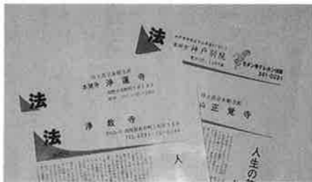
昨年春のお彼岸号

昨年は年間を通して(春彼岸・お盆・報恩講)毎回二千五百部前後を教区内各地のお寺や門徒推進員さんにご利用いただき「何度でもゆっくり読み返すことができてうれしいですね」と好評です。