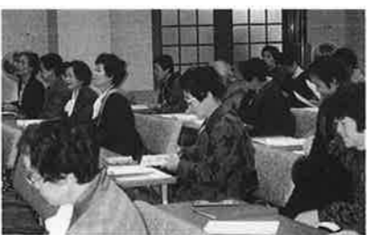
はちす会が新年会

って脳死認定がされる方向だろう。二十五年には外国で人工心臓ができるのでそれまでの手段が移植という見方もある。二、仏教全般的に見ると否定的である。(七割位)提供しようとする行為は崇高であるが、求める側には限度がない。(人間の間持つ煩悩性)三、個人的には：臓器提供自体は崇高な行為であり、否定しない/自己決定権が大切/私は脳死者からの臓器提供は受けたくない。(その理由として)交通事故等脳死者の出現を待つことになる。