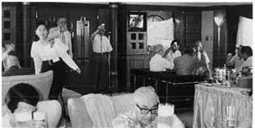
布教団船内での懇談会

化センター設立総合計画収支現況や工事の進捗状況についての報告があった。13日 仏婦神戸ブロック研修会を兵庫県民会館で。講師は十一日に引き続き鷹谷師。三百四十七人が参加。例年は神戸別院で開催だが今年度は改築のため別会場に。来年度が楽しみとの声も。青年僧侶の役員会を別院で。14日 仏婦但馬ブロック研修会を朝来組如來寺で。講師は前日に引き続き鷹谷師。八百八十八人が参加。14日 16日 別院常例法座。講師は富永眞哉師(佐用組浄宗寺)。15日 保育連盟園長・主任研修懇談会を山手幼稚園で。16日 近畿仏婦大会打合せ会が津村別院で。17日 仏婦阪神・神戸ブロック研修会を神明組浄光寺で。講師は久堀弘義師(神戸湊組行願寺)が主事。18日 建設推進委員会、建設推進常任委員会を別院で(一面に別記)。19日 仏婦西播ブロック研修会を姫路西組